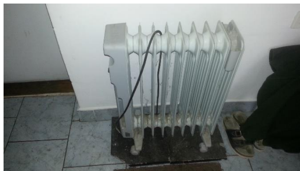
Přenosný elektrický olejový radiátor