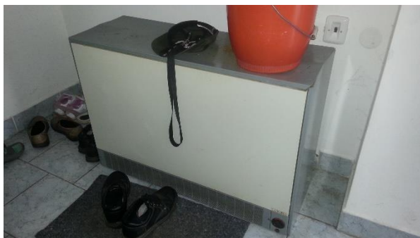
Elektrická akumulční kamna

Umělé osvětlení budovy je soustavou převážně zářivkových zdrojů, ovládání ruční.