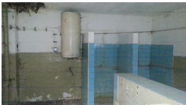
Sociální zařízení s přímotopným zásobníkem

Předmětná budova je téměř 20 let bez využití a v havarijním stavu, technologické zařízení budovy bylo demontováno nebo zcizeno. Hodnocení energetické náročnosti budovy předpokládá stav budovy s funkčním tzb a pro typizované užívání, pro které byla určena.